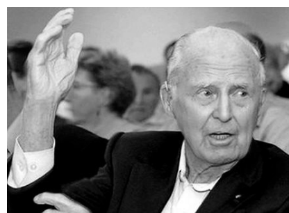
Hãy vươn tới những vì sao