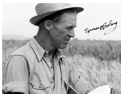
Khoa học xanh