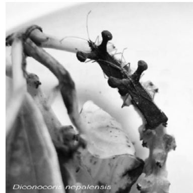
Bọ xít lưới hại tiêu (phải) rệp sáp giả hại cây hoa-kiếng (trái)