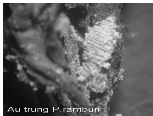
Thiên địch bọ cánh lưới ăn rệp sáp giả

Mỗi một công trình nghiên cứu, mỗi một bài báo viết ra hay một đề tài của học viên cao học, sinh viên đại học đều là một dấu ấn trong lòng tôi. “Có những người thành đạt mà không cần trải qua nhiều trường lớp, nhưng điều đó không có nghĩa con thôi nỗ lực học tập. Kiến thức con học được chính là vũ khí con cần có, hãy nhớ người ta không thể làm gì nếu họ chỉ có tay không” , lại một lời cha khuyên con chân chính. Thật là quá đúng, không thể làm gì nếu chỉ có tay không. Tôi không ngừng cố gắng, nhất là về chuyên môn và đã được phong học hàm phó giáo sư năm 2002. Ngày bảo vệ các công trình nghiên cứu trước Hội Đồng Giáo Sư cấp cơ sở đúng là một kỷ niệm đẹp khó quên.